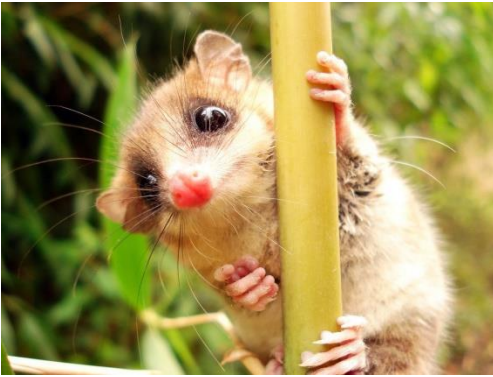
Monito del Monte