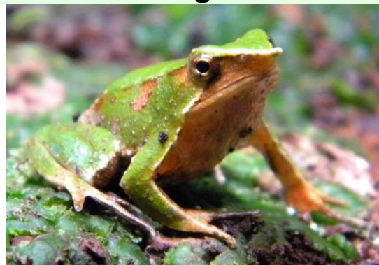
Ranita de Darwin