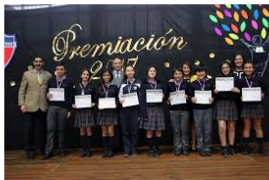
Premiación en colegios