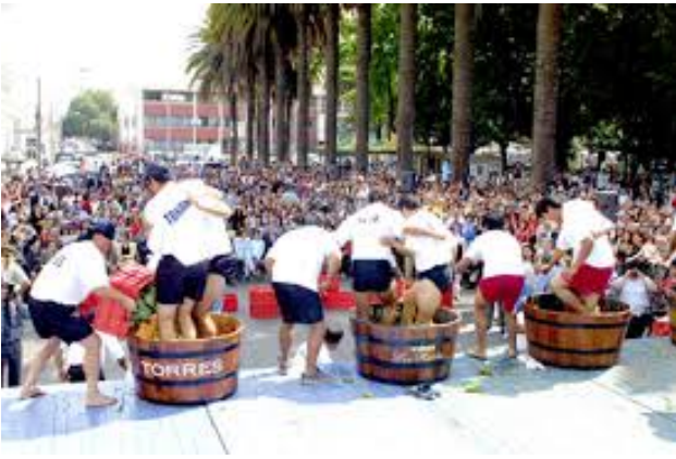
Fiesta de la vendimia