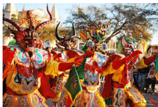
Fiesta de la tirana