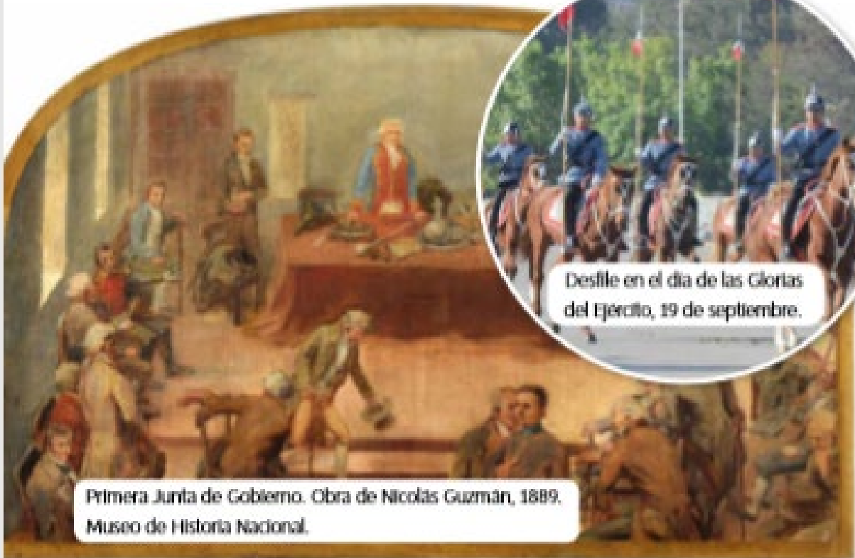
Primera Junta de Gobierno. Obra de Nicolás Guzmán, 1889. Museo de Historia Nacional.

El 18 y 19 de septiembre celebramos nuestras fiestas patrias. El 18 conmemoramos la formación de la primera Junta de Gobierno y el 19 celebramos el día de las Glorias del Ejército.