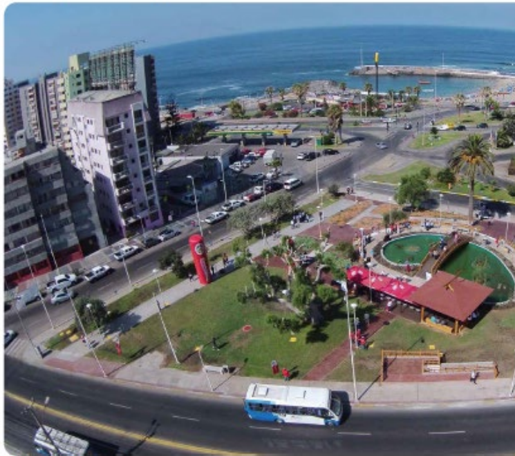
Ciudad de Antofagasta.

En las ciudades los paisajes se mezclan. Se pueden encontrar elementos naturales y otros creados por el hombre.