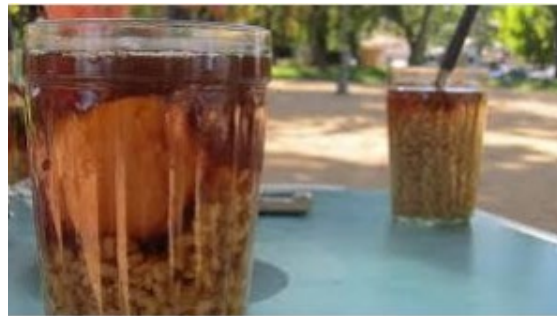
Mote con huesillos