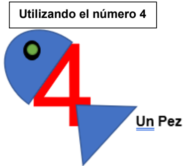
Utilizando el número 4