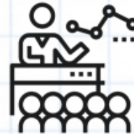
Hablar en público