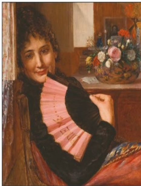
“COQUETERÍA” 1890 Alfredo Valenzuela Puelma, (1856-1909) Óleo sobre tela