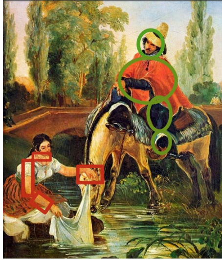
“El huaso y la lavandera” 1835, de Mauricio Rugendas.