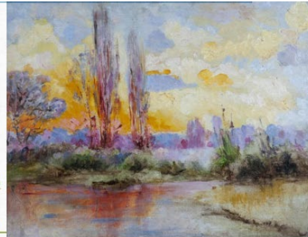
"Puesta del sol" Juan Francisco González (1853-1933). Óleo sobre tela.

Los invito a observar un vídeo Cuento "El monstruo de los colores", nos ayudara a explicar las emociones que las podemos representar con colores: