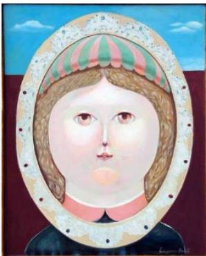
La muñeca triste Eugenio Brito (1929)

Una de las tareas primordiales de las artes visuales es expresar alguna emoción o narrar como me siento, a partir de imágenes.