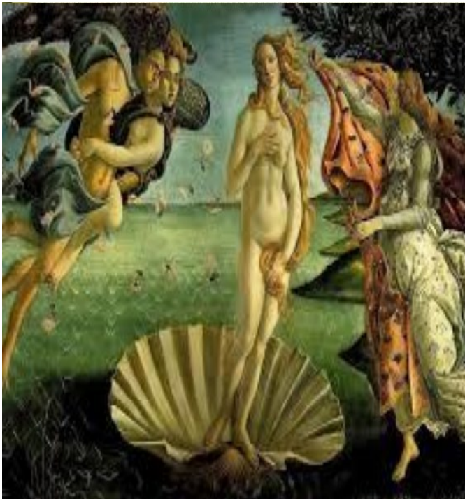
“El nacimiento de Venus” Boticelli.