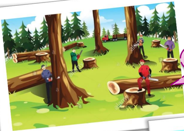
Tala de bosques