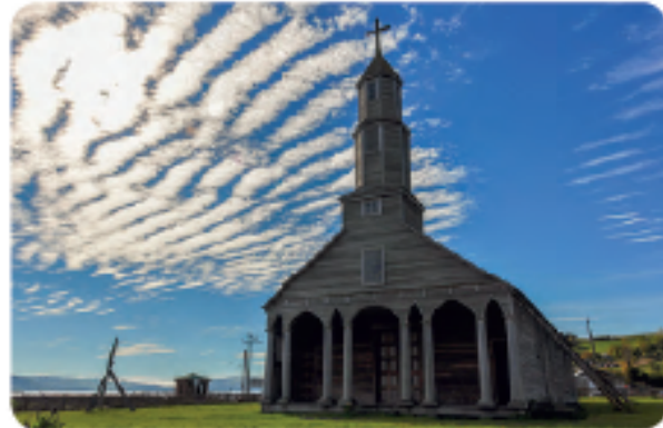
» Iglesia de Chiloé, Zona Sur.