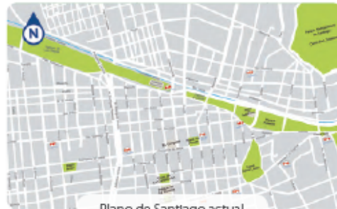
Plano de Santiago actual

» Heredamos de los españoles la forma de las ciudades, por ejemplo Santiago.