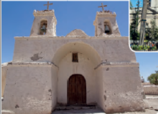
« Iglesia de Chiu Chiu, Zona Norte.