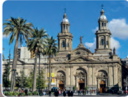
« Catedral de Santiago, Zona Central.

Fuente: Memoria Chilena. Misioneros y mapuches. (Fragmento adaptado).