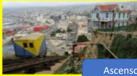
Ascensor de Valparaíso