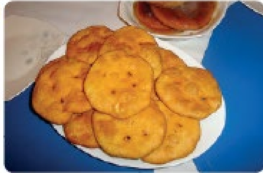
🌿 Sopaipillas chilenas, pueden comerse dulces o saladas.