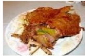
Carnes: llama, alpaca, cordero, cabras, vizcachas.