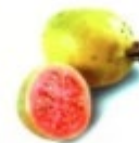
Piña, guayaba y mango