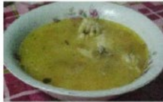
Quínoa, el alimento de los dioses