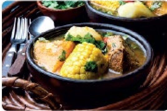
🌿 Cazuela, un caldo típico de Chile.

Recurso 2 Las comidas de Chile: un patrimonio para saborear.