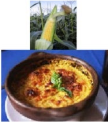
Pastel de choclo