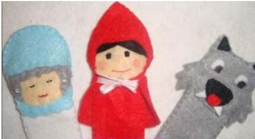
ejemplo de títeres con paño lenci.

NOTA: Una vez finalizada la actividad el alumno con la ayuda de sus padres deberán enviar el video a la docente junto al títere para su revisión.