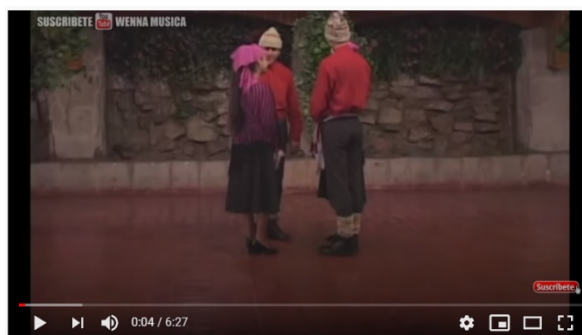
Zona sur - Bailes tipicos chilenos - Musica y Bailes Chilenos