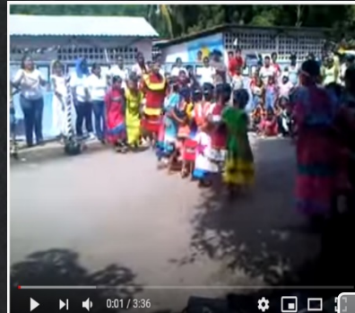
Mare-Mare Kariña en Neveri Central