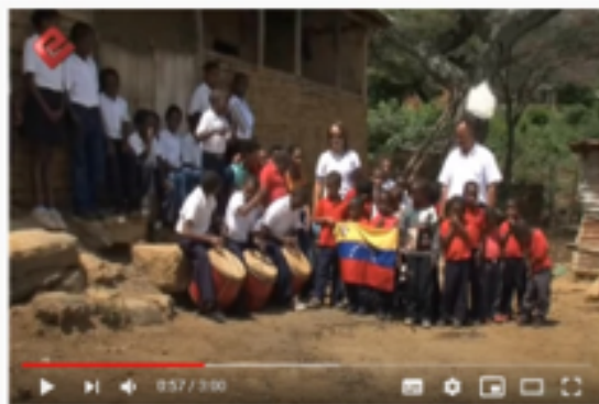
Danzas Tradicionales de Venezuela