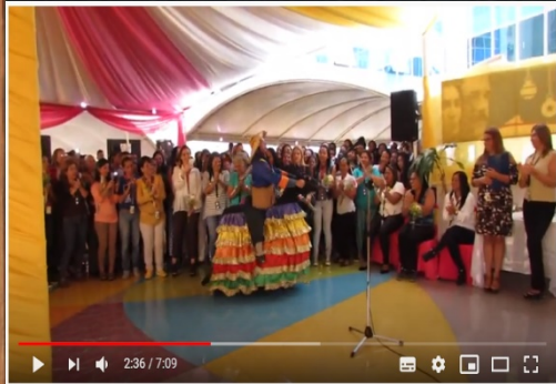
Baile de la Burriquito 2019