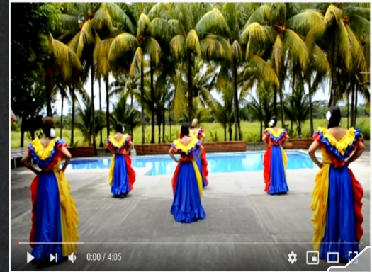
Joropo de los Llanos Venezolanos. San Carlos, Edo. Cojedes, Venezuela