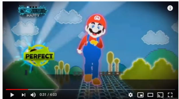
[Just Dance 3] Ubisoft meets Nintendo - Just Mario

https://www.youtube.com/watch?v=39L-M5nhx6Y