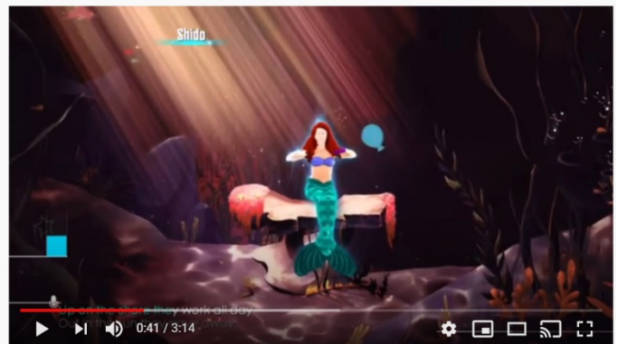
Sirenita Just dance español latino

https://www.youtube.com/watch?v=D334utRiba8