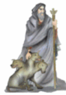
HADES/PLUTÓN El averno (infierno)