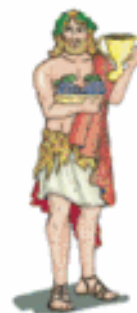
DIONISIO/BACO El vino