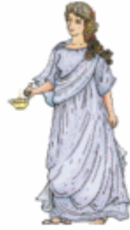
HESTIA/VESTA El hogar