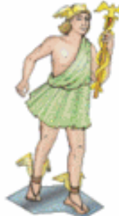
HERMES/MERCURIO El mensajero