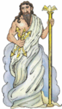
ZEUS/JÚPITER Dios de los dioses