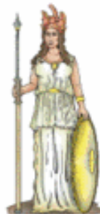
ATENEA/MINERVA La sabiduría