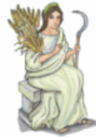
DEMÉTER/CERES Los cultivos