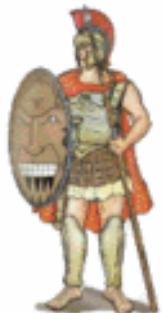
ARES/MARTE La guerra