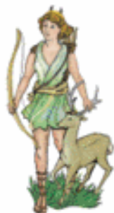
ARTEMISA/DIANA La caza