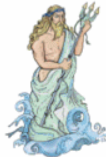
POSEIDÓN/NEPTUNO El mar