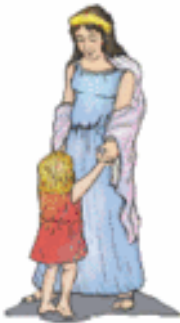
HERA/JUNO La familia