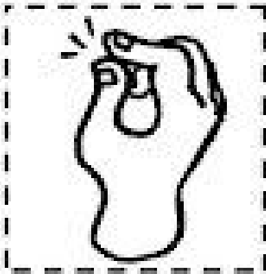
Chasquear los dedos