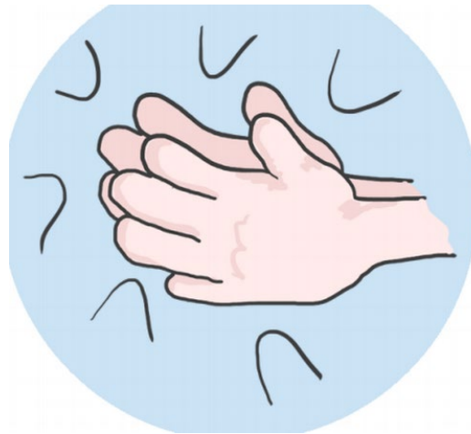
sonidos con las manos – aplausos