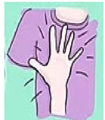
golpes suave en el tórax