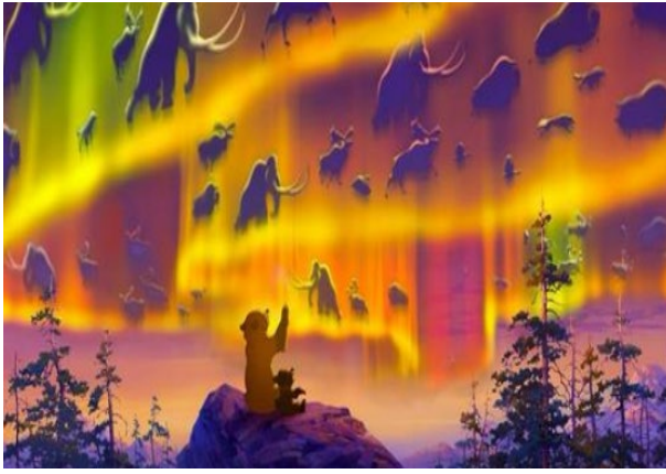
Película “tierra de osos”