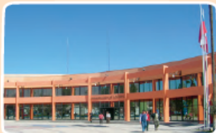
Municipalidad de Copiapó.

Nombre del actual presidente o presidenta de la Corte Suprema: