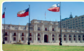
Palacio de La Moneda, Santiago.

Tiene la facultad de designar a otras autoridades como los ministros y ministras, quienes se encargan de áreas como salud, justicia, transporte y educación.