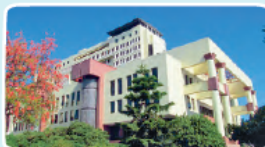
Congreso Nacional, Valparaíso.

Nombre del actual Presidente de la República: