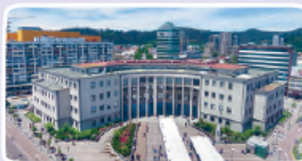
Tribunales de Justicia de Concepción.

Los miembros de la Corte Suprema, son designados por el presidente de la República con acuerdo del Senado.