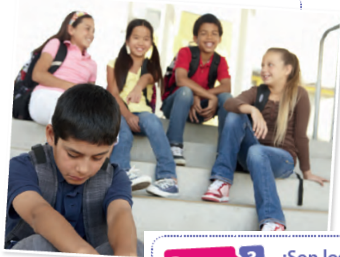
(S. i). (29/05/2018). B. podría generar

Chile es el país donde el rendimiento académico de los escolares es el más afectado por la violencia en el aula de toda Latinoamérica, así lo indica el estudio Las violencias en el espacio escolar publicado por Cepal y Unicef en 2017. La Superintendencia de Educación chilena además entregó cifras preocupantes: El segundo ciclo (5° a 8° Básico) concentra las tasas más altas de denuncias por maltrato entre estudiantes y el 35,8% de estos ataques se registra dentro del aula. Además, los datos publicados revelaron que en los maltratos físicos, el 58,4% de las denuncias analizadas el agredido fue un hombre, y en el 41,6% fue mujer.