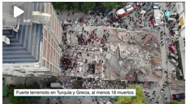
Al menos 17 muertos y más de 120 heridos en un terremoto registrado en el mar Egeo

El temblor, de 6,8 grados de magnitud, ha hecho derrumbarse al menos una decena de edificios en varios barrios de Esmirna (Turquía), y ha provocado pequeños tsunamis.