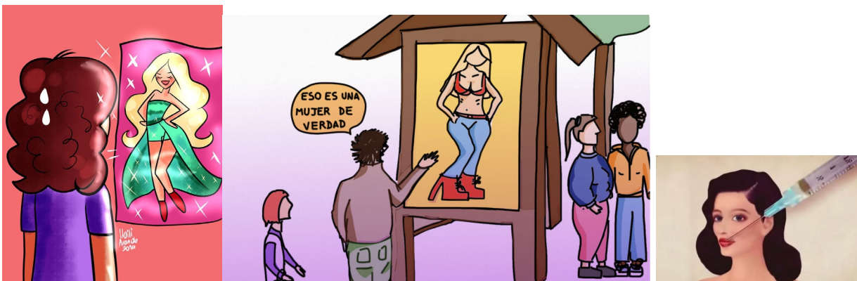
Estereotipo de Mujer